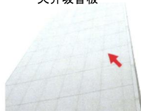
フレキシブルボード・石綿セメント板