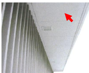
軒天けい酸カルシウム板